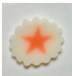
海の星型スライス なると 160g