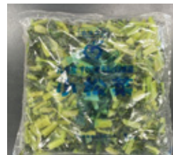
国産小松菜 (3cmカット)IQF 1kg