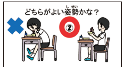
令和5年度献立専門委員会第二分科会作成動画 ※詳細は4ページ