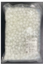
星型ナタデココ 固形量約 800g