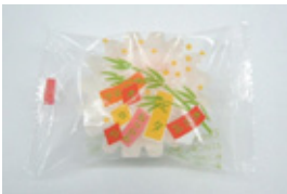
キラキラ餅(みかん)40g