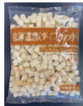
冷凍豆腐(岡山県産) ダイスカット 1kg