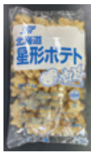
北海道星形 ポテト 1kg