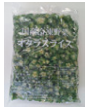
国産オクラスライス 1kg