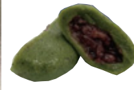
※半分に切った様子