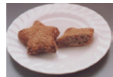
スターポークミンチカツ 40g・50g・60g