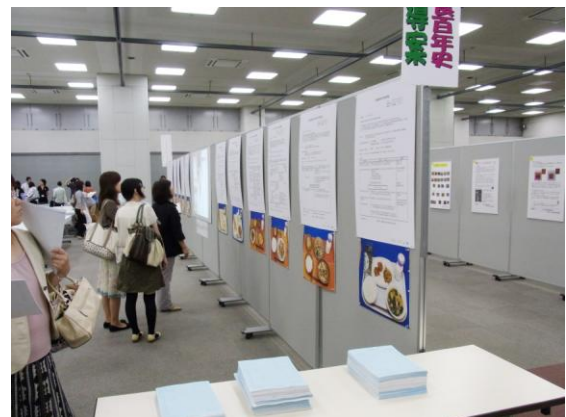
学習指導案パネルと冊子コーナーの設置