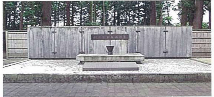
学校給食発祥の地記念碑(山形県鶴岡市大徳寺境内)