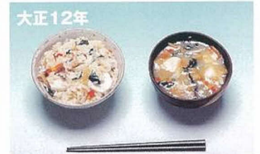
大正12年 五色ごはん・栄養みそ汁