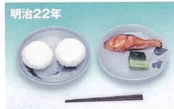
明治22年 おにぎり・塩鮭・菜の漬物