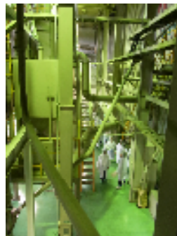
工場内はパイプばかりです