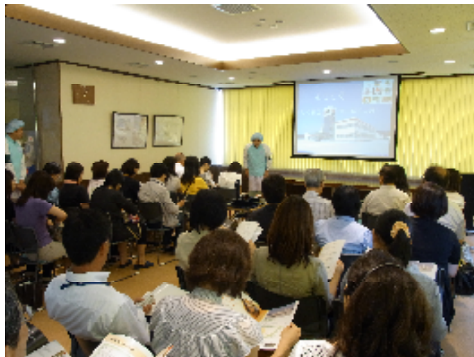
視察前の説明を聞きます 工場内は撮影禁止でした。