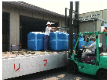
玄米が入荷していました