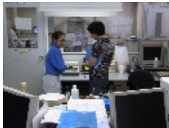
分析室（L O T 毎に、味、水分、硬さ等のチェック）