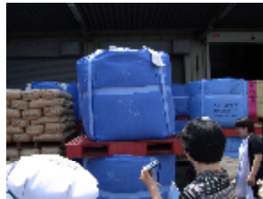
給食用の玄米です