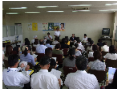
視察前の説明を聞きます