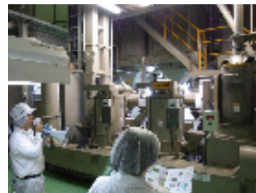
精米は精米機3台で行います