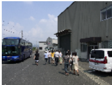
岡山パールライスに到着