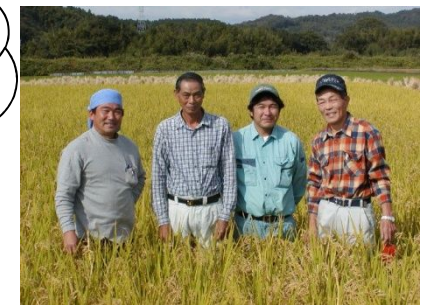
黄金色に実ったはいいぶきと 生産者のみなさん