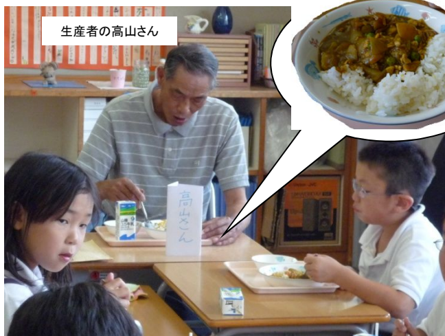
於：津山市立高倉小学校

H21年に、初めて津山市内の給食ではいぶきが提供された時には、生産者、市長、教育長と一緒に給食を食べる会を実施しました。