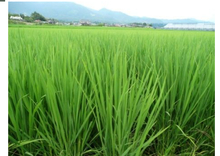
すくすく育っています